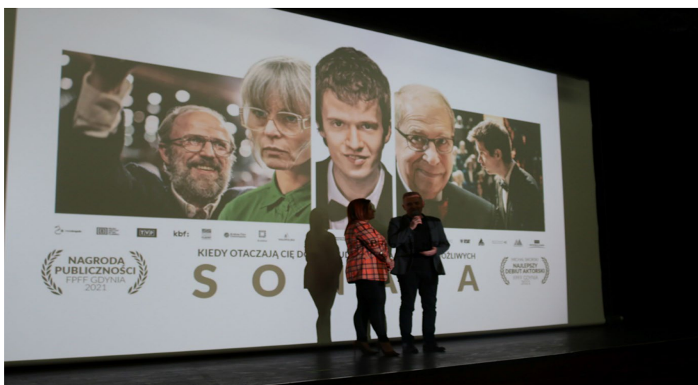
Pokaz filmu „Sonata”.