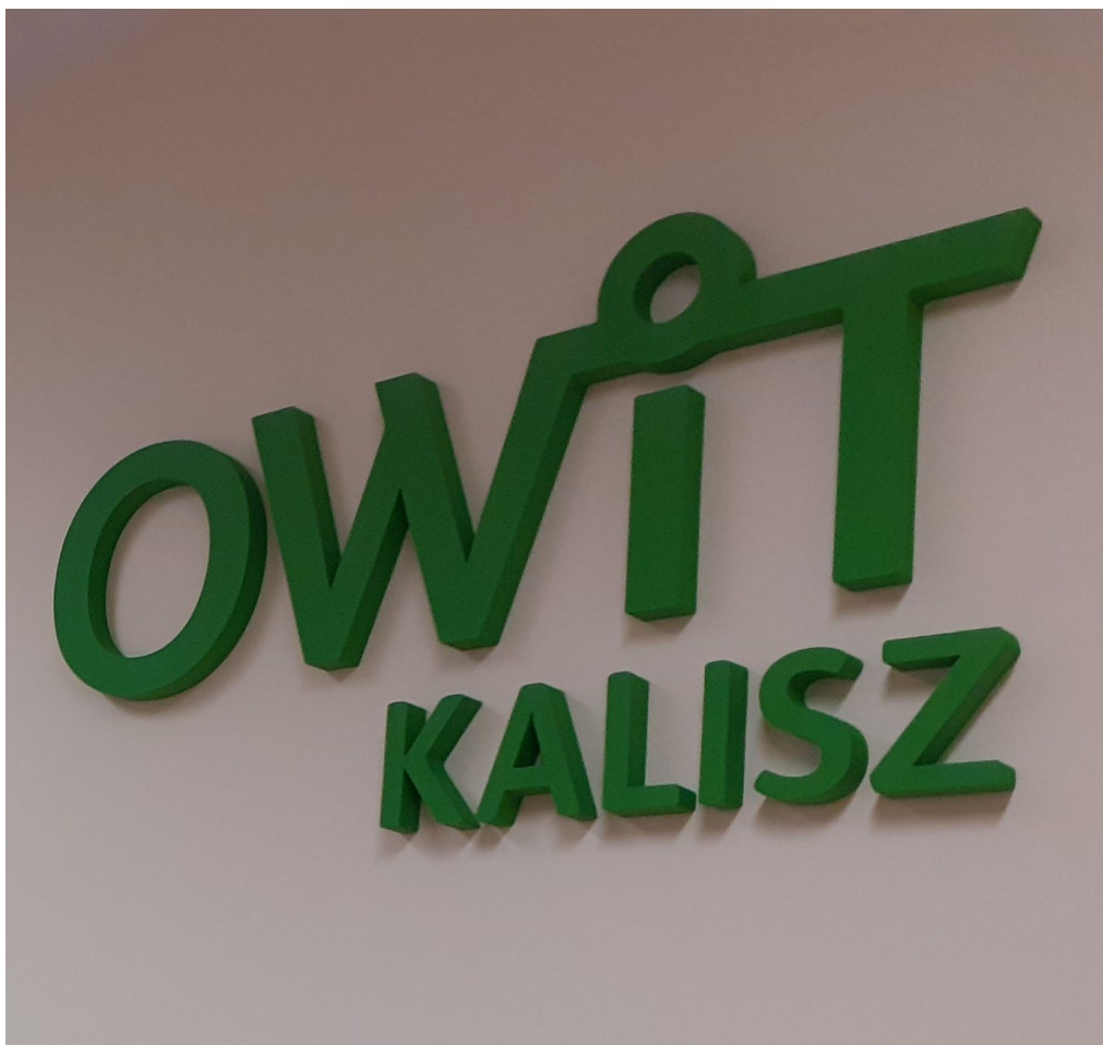
Ośrodek Wsparcia i Testów w Kaliszu