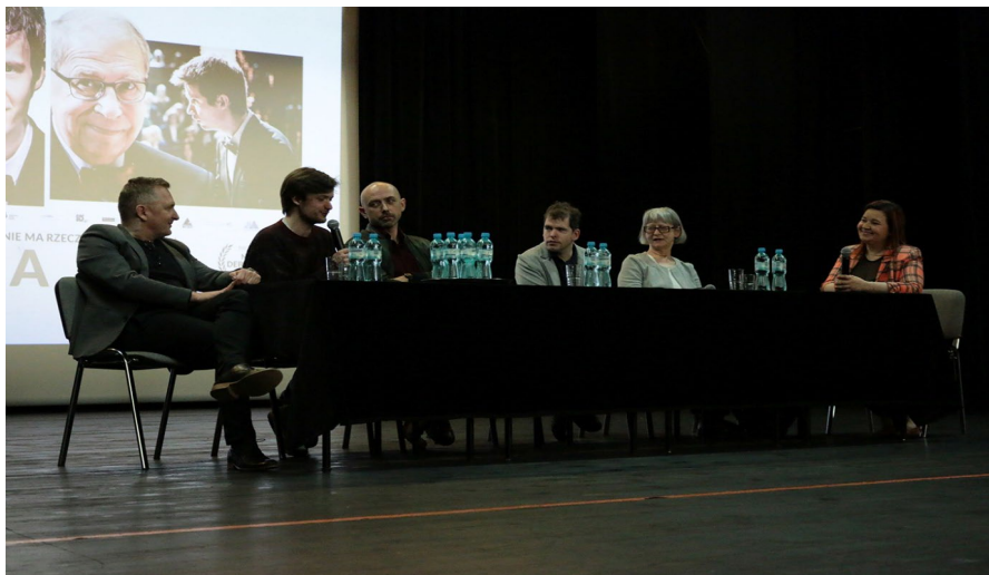
Pokaz filmu „SONATA”.