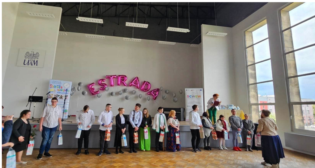
Wojewódzki Festiwal Piosenki ESTRADA. Na zdjęciu uczestnicy festiwalu.

Festiwal był okazją do zintegrowania uczniów, nauczycieli, opiekunów z różnych typów szkół oraz miejscowości.