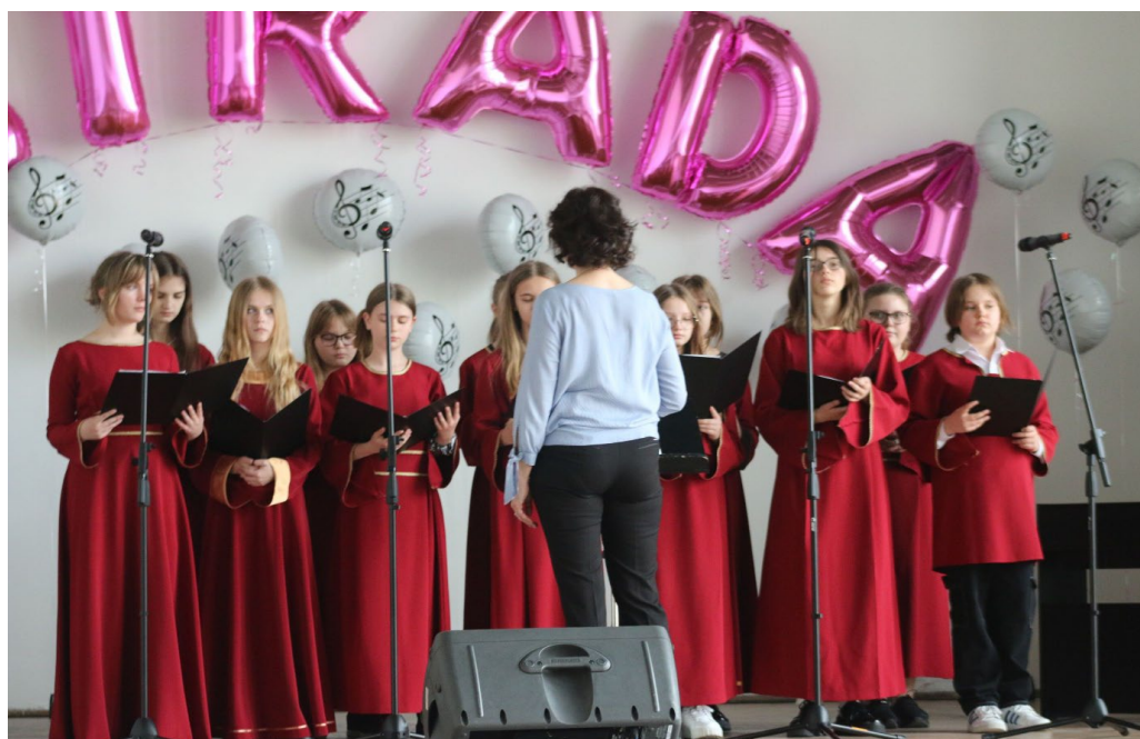
Gościnny występ Chóru Duodecimus podczas festiwalu „Estrada” Na zdjęciu Chór Duodecimus ze Szkoły Podstawowej Nr 12 im. Bolesława Pobożnego w Kaliszu